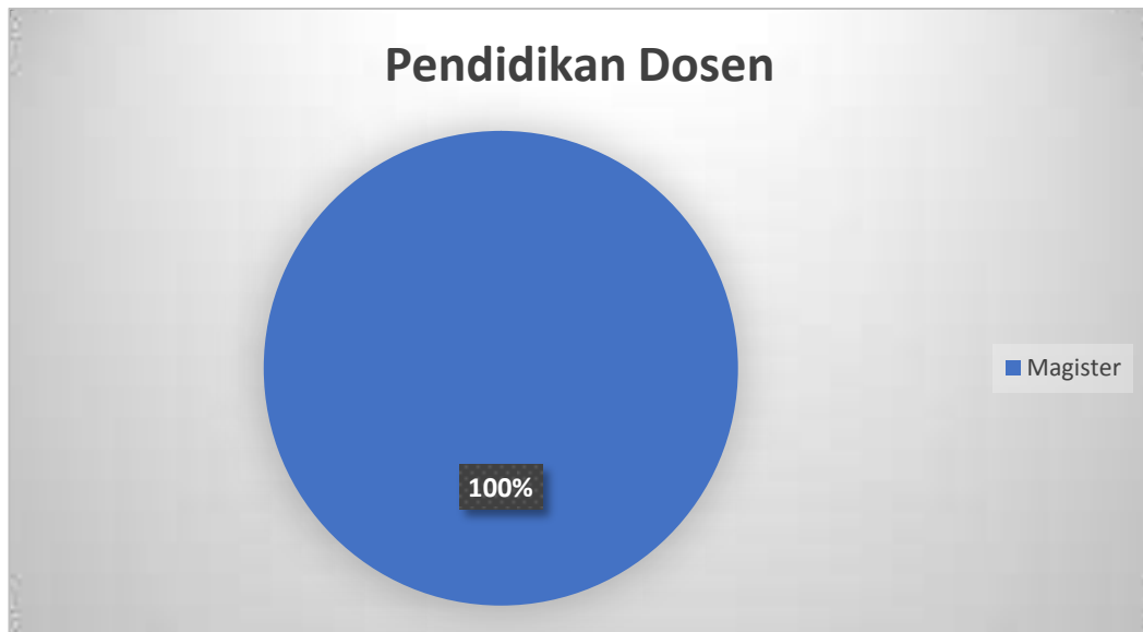
Gambar 3.2 Tingkat Pendidikan Dosen PS Akuntansi

Profil dosen tetap Program Studi Sarjana Akuntansi, sebagaimana disajikan pada Gambar 3.3, saat ini berjumlah 7 (Tujuh), dimana kesemuanya merupakan dosen tetap Yayasan. Dilihat dari kesesuaian bidang program studi sarjana akuntansi ada 6 dosen yang sesuai, sedangkan 1 dosen tidak sesuai, namun mendukung pembelajaran program studi jurusan akuntansi di bidang Manajemen. Sebanyak 6 orang dosen dengan bidang keahlian yang sesuai dengan program studi jurusan akuntansi, dilihat berdasarkan tingkat pendidikan sebanyak 100% berpendidikan S2.